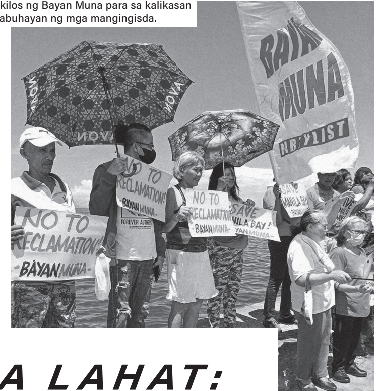
Pagkilos ng Bayan Muna para sa kalikasan at kabuhayan ng mga mangingisda.

Mahal natin ang ating bayan, kaya inuuna natin ito.